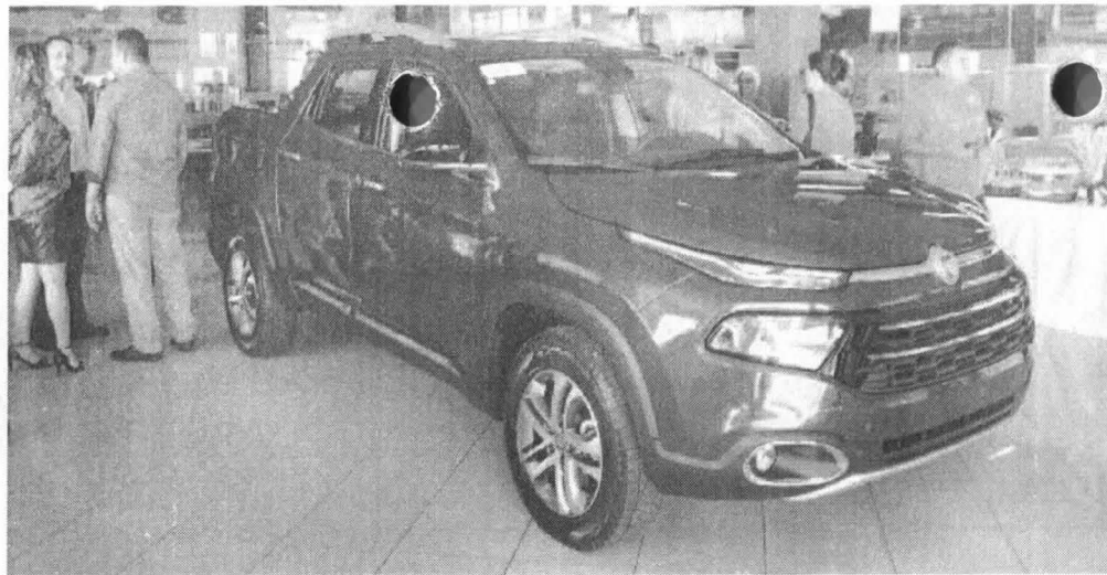
Fiat Toro foi apresentado ontem a convidados e está exposto no salão da Taguatour Veículos, na Cohama

A triatleta Shirley Orivane ficou bastante impressionada. O Toro tem design e acabamento lindo e moderno, sem contar o espaço que ele proporciona. Ideal para pessoas que buscam conforto e sofisticação para rodar na cidade e também se aventurar em terrenos offroad. Fiquei im-