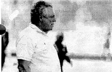
Abel espera novo atacante no Fluminense

A diretoria do Fluminense pretende usar parte da receita recebida com a negociação de Henrique Dourada para contratar uma peça de reposição para o setor. O artilheiro se transferiu para o arquibancado, deixando uma lacuna no setor ofensivo