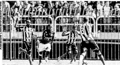
Fla e Bota se enfrentaram no Raulino de Oliveira ano passado

O Botafogo chega com a moral em baixa para a disputa desta semifinal após passar um dos maiores vexames da história do clube ao ser eliminado na primeira fase da Copa do Brasil pela