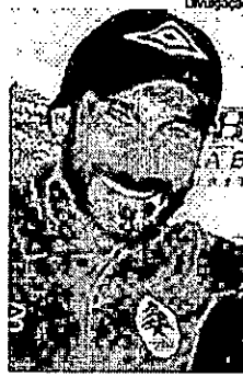
Dirigente do Boavista é cotado no Flamengo