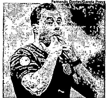
Jair Ventura tem a missão de comandar o time na Argentina

Um nome que está em pauta é o de Kiker Gladiador, que está disputando o Campeonato Parana-