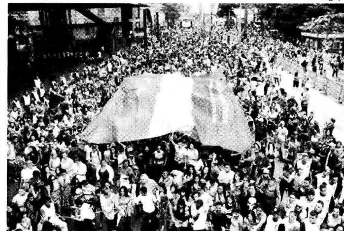
Avenida Paulista ficou tomada de gente ontem durante Parada Gay