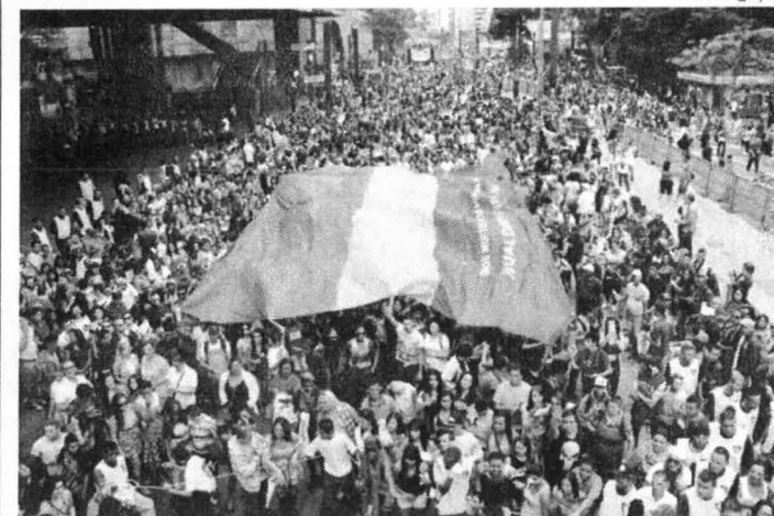
Avenida Paulista ficou tomada de gente ontem durante Parada Gay