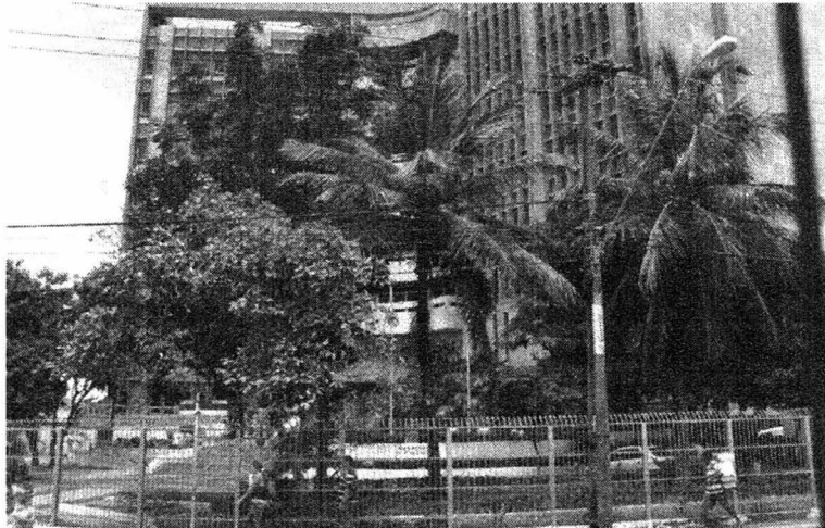
Prédio da Receita Federal em São Luís; prazo para receber declarações vai até a meia-noite de quinta-feira