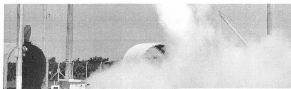
Diversos lançamentos de foguetes de pequeno porte já foram feitos a partir do CLA, em Alcântara

CLA - Poucos são os países que conseguem reunir, em uma só re-