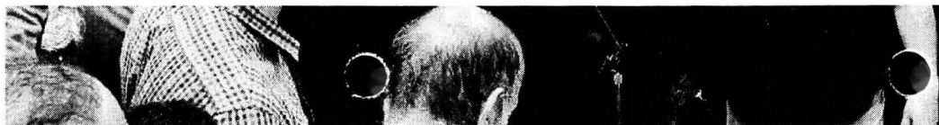
Omar al-Hassi, líder de oposição, discursa no funeral de Saleh Al-Baraki na Praça dos Mártires, em Trípoli

Ataque - Forças leais a esse governo assumiram a responsabilidade pelo ataque aéreo em