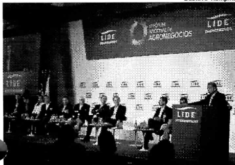
Lideranças políticas e empresariais do agronegócio brasileiro participaram do 6º Fórum Nacional de Agronegócios

Apresentando como tema principal o debate sobre sucessão e governança no agronegócio brasileiro, o 6º Fórum Nacional de Agronegócios, promovido pelo LIDE – Grupo de Líderes Empresariais, que tem o ex-ministro Luiz Fernando Furlan como chairman, reuniu, no sábado (30/9), no Hotel Royal Palm Plaza, em Campinas/SP, mais de 300 participantes, entre lideranças políticas, empresariais e setoriais. O encontro teve a curadoria do ex-ministro da Agricultura, Roberto Rodrigues, que também preside o LIDE Agronegócios.