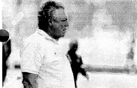
Luca Merconi/Fluminense FC