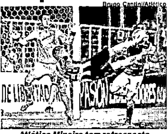
Atlético Mineiro tem retrospecto positivo contra colombianos

Atlético-MG e La Equidad jogam no Independência hoje, às 21h30, pelas quartas de final da Copa Sul-Americana. As duas equipes nunca se enfrentaram antes, pelo que este será seu primeiro enfrentamento direto.