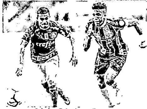
Grêmio e Palmeiras voltam a se enfrentar depois de três dias

O La Equidad sabe da difícil missão que terá pela frente, pois enfrentará um time muito qualificado e estará longe de casa. Para conseguir surpreender e conquistar ao menos um empate, o time do La Equidad terá que armar um forte esquema defensivo, assim tentando neutralizar as jogadas de ataques dos donos da casa. Porém, é importante ir ao ataque, para assim tentar marcar gols. O técnico deverá ir para campo com o que tiver de melhor em seu elenco.