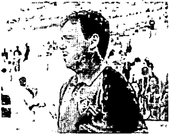
Técnico Fernando Diniz, durante o jogo entre Fluminense e CSA, no Maracanã