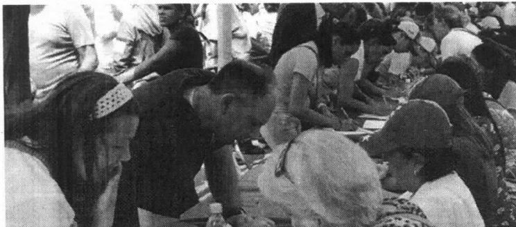
Muitos venezuelanos assinam pedido de referendo para tirar o poder o presidente Nicolás Maduro